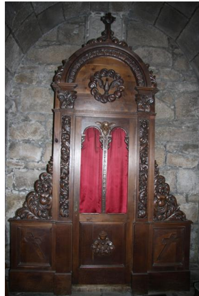
Confesionario na igrexa de San Bieito, de Fefiñáns (1948)