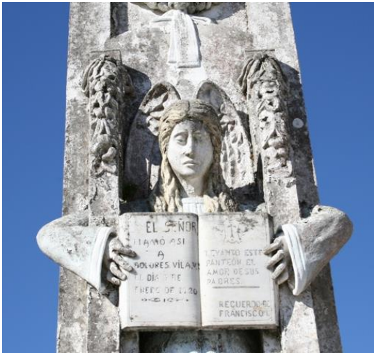
Monumento funerario a Dolores Vila (a súa primeira moza, da que tivo o primeiro fillo), no cemeterio do Grove (1920)