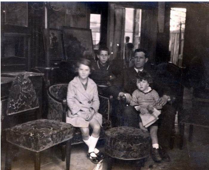
Foto cos seus fillos arredor de 1935.

Ademais do seu traballo de ebanista facía tallas, sobre todo de tema relixioso –crucifixos e imaxes– que se atopan repartidos por moitas casas de Cambados e os arredores. En Cambados ten o altar de San Mamede, en Corvillón (1941), o altar de Fátima, na igrexa parroquial de Cambados (1945) e un grupo escultórico na Igrexa de Fefiñáns (1946).