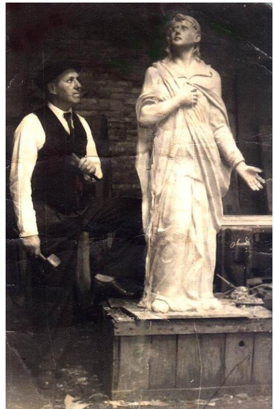
Traballando no San Xoán, 1946